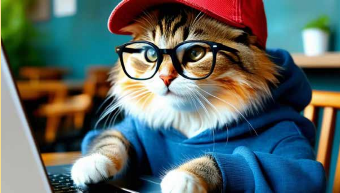
Dieses KI-generierte Bild verursachte bei der Entstehung 4,7 g CO 2 -Äquivalente. Zwei Textfragen verursachen bei großen Sprachmodellen ähnlich viel.