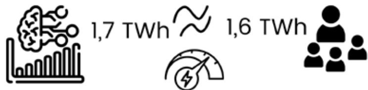
© Eigene Darstellung auf Basis von IEA 2025; HNEE, 2026

Nimmt man an, dass eine Person in Deutschland jährlich etwa 1.600 kWh Strom verbraucht, ergibt sich der Vergleich mit dem Stromverbrauch von etwa 1 Million Personen pro Jahr.